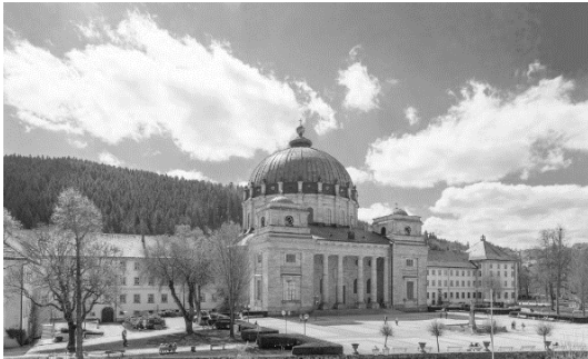
Dom zu St. Blasien

Weiterfahrt nach St. Blasien um 14.15 Uhr zur professionellen Führung